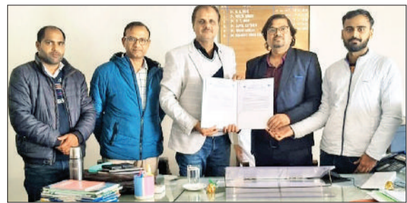
झज्जर। साइन किया गया एमओयू दिखाते हुए दोनों संस्थानों के प्रतिनिधि।