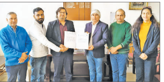
बहादुरगढ़। मौसम केंद्र को लेकर दस्तावेजों का आदान-प्रदान करते प्रतिनिधि।