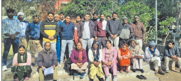
झज्जर। लघु सचिवालय परिसर में उपस्थित एचकेआरएनएल कर्मचारी।

ग्रामीण क्षेत्रों में शिक्षा की गुणवत्ता सुधारने की दिशा में अरावली पावर कंपनी प्राइवेट लिमिटेड ने सराहनीय पहल करते हुए राजकीय विरथ माध्यमिक विद्यालय लिलोड का कार्यालय किया है। इस पहले के अंतर्गत विद्यालय की कक्षाओं से लेकर विज्ञान प्रयोगशाला, कंप्यूटर लैब और पुस्तकालय तक को आधुनिक फर्नीचर और सुविधाओं से सुसज्जित किया गया है। वीरवार को आयोजित शुभारंभ कार्यक्रम पहल नन्हे कलाम से जुड़े विद्यार्थियों और उन्हें पढ़ाने वाले शिक्षकों के साथ भी संवाद किया गया। अधिकारियों ने बताया कि यह कार्यक्रम एपीसीपीएल द्वारा सॉलफ रिलायंट इंडिया नामक गैर-सरकारी संस्था के सहयोग से संचालित किया जा रहा है, जिसके अंतर्गत सरकारी स्कूलों के 10 से 12 वर्ष आयु वर्ग के विद्यार्थियों को स्कूल के बाद