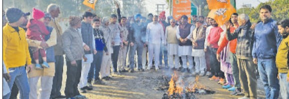
बहादुरगढ़। सेक्टर-2 में राहुल गांधी का पुतला फूँकते भाजपाई।

वीरवार को भाजपा के आक्रोशित कार्यकर्ताओं ने लोकसभा में नेता प्रतिपक्ष राहुल गांधी का पुतला फूँका। संसद परिसर में केंद्रीय मंत्री सरदार रवनीत सिंह बिट्टू को राहुल गांधी द्वारा गद्दार दोस्त कहे जाने से भाजपाइयों में जबरदस्त नाराजगी दिखाई। प्रदर्शन के दौरान राहुल गांधी के खिलाफ जोरदार नारेबाजी की गई और कार्यकर्ताओं ने माफी नहीं मांगे