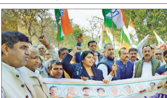
झज्जर। लघुसचिवालय परिसर में प्रदर्शन करते हुए कांग्रेस कार्यकर्ता।

ज्ञापन में लिखा है कि वे पचास से अधिक कर्मचारी कोरोना समय से हेल्थ विभाग में अपनी सेवाएं दे रहे हैं। उनकी प्रतिनियुक्ति रिन्यू नहीं है फिर भी वे अपना कार्य पूरी निष्ठा से कर रहे हैं। वेतन न मिलने के कारण उन्हें घर चलाने में कठिनाई आ रही है। वे इस संबंध में अपनी समस्या को पिछले माह समाधान शिविर में रख चुके हैं लेकिन कोई समाधान नहीं हो पाया।