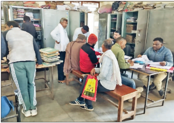
झज्जर। पटवारी भवन में कामकाज करते हुए पटवारी।