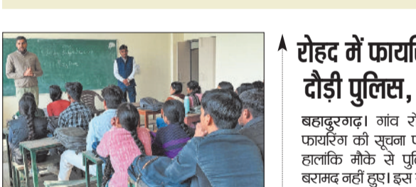
झज्जर। व्याख्यान कार्यक्रम में अपनी बात रखते हुए विषय विशेषज्ञ।