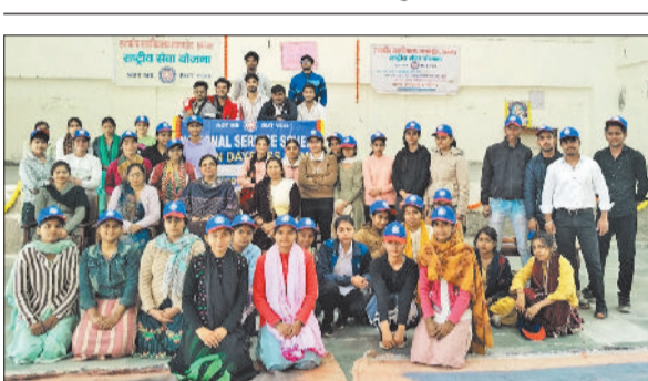
झज्जर। सात दिवसीय एनएसएस शिविर के शुभारंभ पर शिक्षकों के साथ उपस्थित स्वयंसेवक।

दो तहसीलदार व एक नायब तहसीलदार को निर्वासित किए जाने के विरोध में वीरवार को तहसीलदार व नायब तहसीलदार हड़ताल पर चले गए। इसके कारण तहसीलों में कामकाज प्रभावित रहा और सरल केंद्र में विंडो खाली पड़ी दिखाई दी। हड़ताल के कारण लोगों की रजिस्ट्री नहीं हो पाई। जिसके कारण लोग परेशानी भी दिखाई दिए। इसके अलावा जिन लोगों ने एफिडेविट पर तहसीलदार और नायब तहसीलदार के हस्ताक्षर